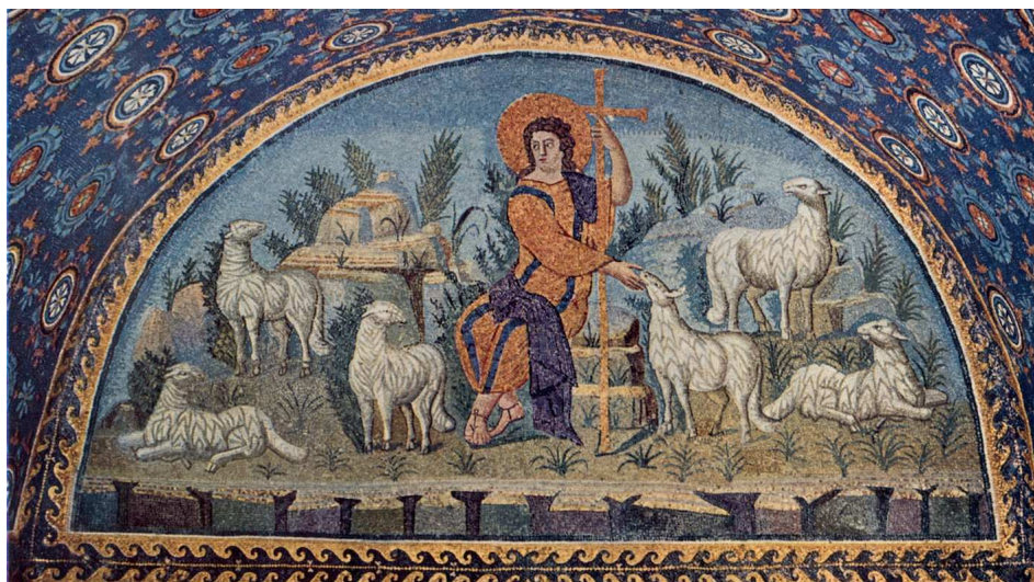
De goede herder Mozaïek in het Mausoleo di Galla Placidia, Ravenna